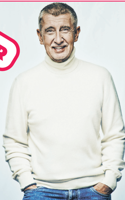
Zadávatel: ANO 2011. Zpracovatel: MHK Lab s.r.o.

Už brzy budou mít všichni občané České republiky možnost zvolit prezidenta. V přímé volbě rozhodnou, kdo zemi v následujících pěti letech povede. Za politikem Andrejem Babišem je kus práce, všichni ho znají. Ale jaký by byl prezident? Co od něj čekat?